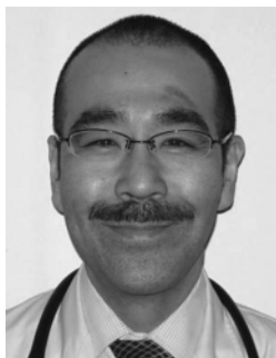
越谷市立病院 診療部長(兼) 呼吸器科部長