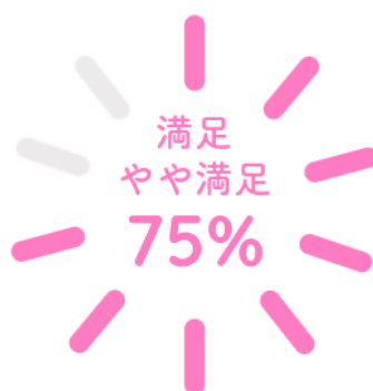
施設サービス満足度