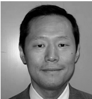
越谷市立病院 泌尿器科部長