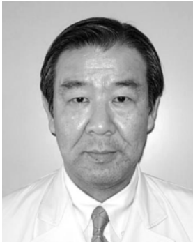
越谷市立病院 副院長(兼) 消化器科部長