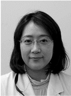
越谷市立病院 眼科部長